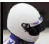
IL PILOTA MASCHERATO