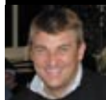
L'UOMO DELLO SPETTACOLO