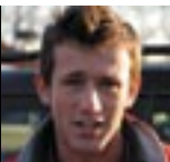
ERA IN PISTA E L'HA PROVATO