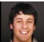
UN REDATTORE DI TKART