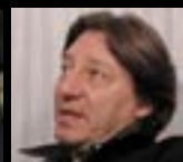
L'EX PILOTA DI FORMULA 1