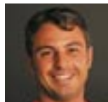
UNO DEI NOSTRI FOTOGRAFI